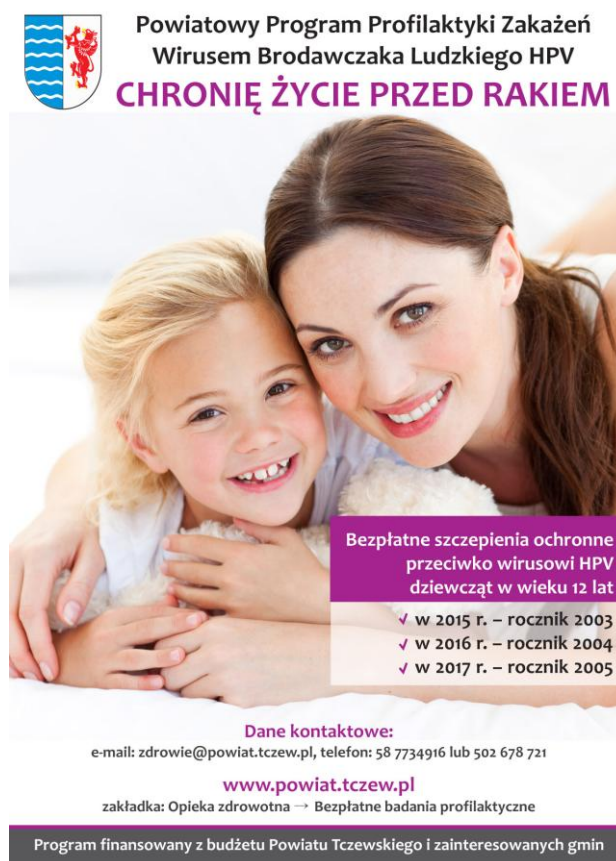
Rys. 1 Wzór plakatu

Dystrybucja plakatów przeprowadzona będzie w 2015 roku. Zgodnie z założeniem plakaty wywieszane będą w urzędach, innych placówkach użyteczności publicznej oraz na tablicach ogłoszeń w sołectwach.